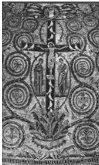
L'arbre dans l'art

L'arbre de Jessé est un arbre généalogique tout simplement. Il représente la généalogie humaine du Christ, à partir de Jessé, père du roi David, comme un arbre dont la racine est Jessé, la fleur la Vierge Marie, et le fruit Jésus.