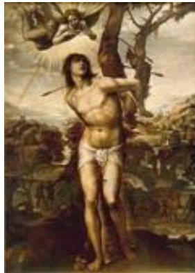
Illustration: Saint Sébastien et les flèches, peinture de Il Sodoma, vers 1525.